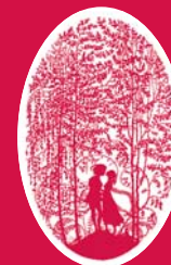
Jorinde und Joringel